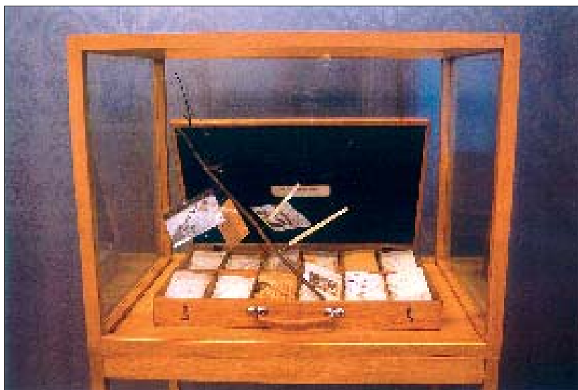
De brieven van Van Biesen in een koffer, een bibliotheek van verbeelding.

bare bibliotheek en worden in een koffer, een schrijn, gelegd en gesloten: wat blijft is een beeld. Wat is dan de bestaansgrond van de taal? In deze kunstwerken wordt het publiek de zekerheid van de tekst ontnomen en tot zichzelf terug geleid met de vraag naar 'Wie ben ik zonder taal? Wat doet de woordenloze wereld mij?'. De werken van De Cordier en Van Biesen zijn bibliotheken van verbeelding. Ze bergen kwetsbare woorden in een schrijn. Ze beschouwen woorden als vlinders, sterk in hun vlucht, breekbaar in hun rust.